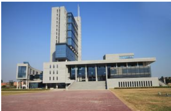
福建工程学院办公楼

学校现有旗山、鳝溪、浦东、铜盘等校区，总占地面积136.88公顷，校舍建筑面积65.78万平方米，固定资产总值16.05亿元，教学科研仪器设备总值3.61亿元，馆藏纸质图书240.41万册，电子图书224.73万册，现有全日制在校学生24200多人，在读硕士研究生268人（含外国留学生），15个学院，55个本科专业，涵盖工学、管理学、文学、理学、经济学、法学、艺术学等7个学科门类，拥有1个省级特色重点