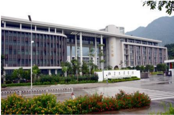
福建工程学院校大门

解放前为享有盛誉的“福建高工”，是福建乃至全国职业教育的一面旗帜。1953年学校分立为轻工业部福州工业学校和福州建筑工程学校，之后两校几易校名，2000年福建高级工业专门学校与1985年成立的福建中华职业大学合并组建福建职业技术学院。2002年福建建筑高等专科学校与福建职业技术学院合并升格为福建工程学院。2013年经国务院学位委员会批准为硕士学位授权单位，并被确定为福建省重点建设高校。